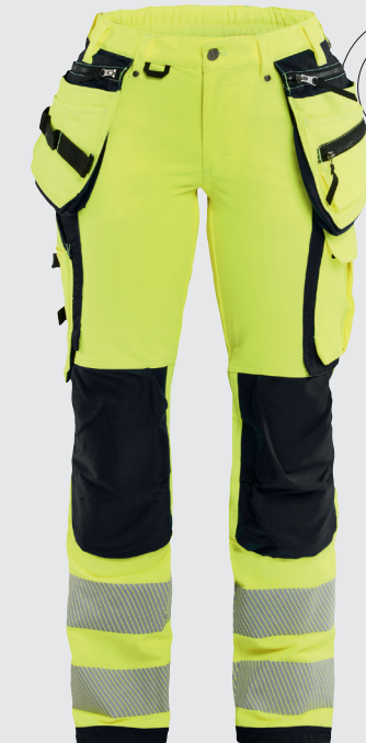
7197 / NAISTEN HIGHVIS RIIPPUTASKUHOUSUT 4-WAY STRETCH / 219.00€+ALV. 25.5%