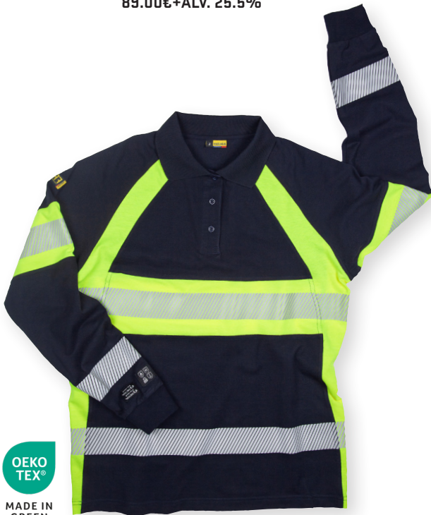
3438 MULTINORM PITKÄHIHAINEN PIKEEPAITA 132.00€+ALV. 25.5%