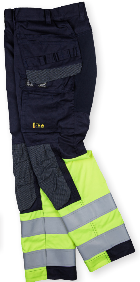
1487 MULTINORM RIIPPUTASKUHOUSUT STRETCH LUONTAINEN PALOSUOJAUS 299.00€+ALV. 25.5%