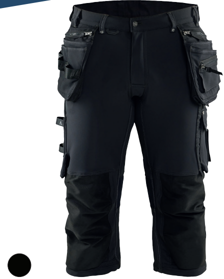
1797 X1900 PIRAATTIHOUSUT 4-WAY STRETCH 204.00€+ALV. 25.5%

Riipputaskushortsit neljään suuntaan joustavalla stretch kankaalla. Shortsit perustuvat malliltaan housuun 1998. Shortseissa on riipputaskut sekä paljon muita taskuja ja yksityiskohtia.