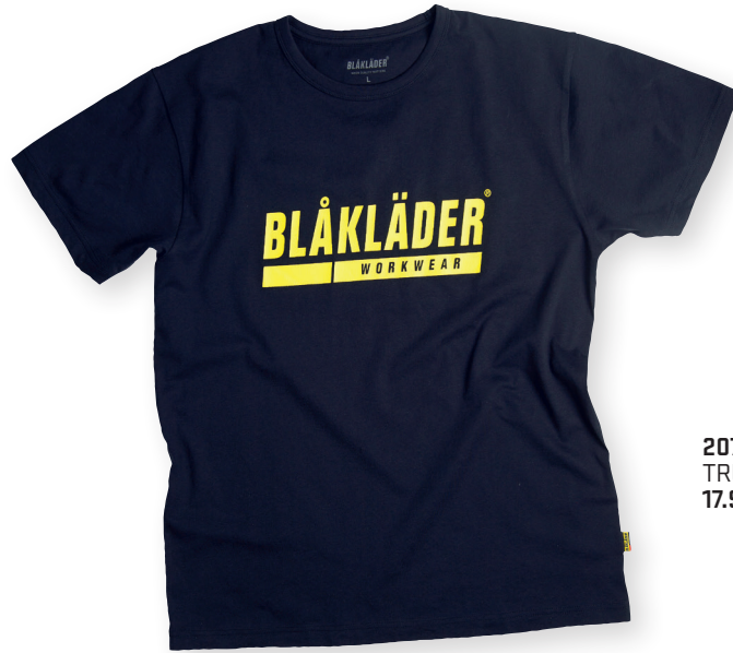
9215 T-PAITA 14.90€+ALV. 25.5%