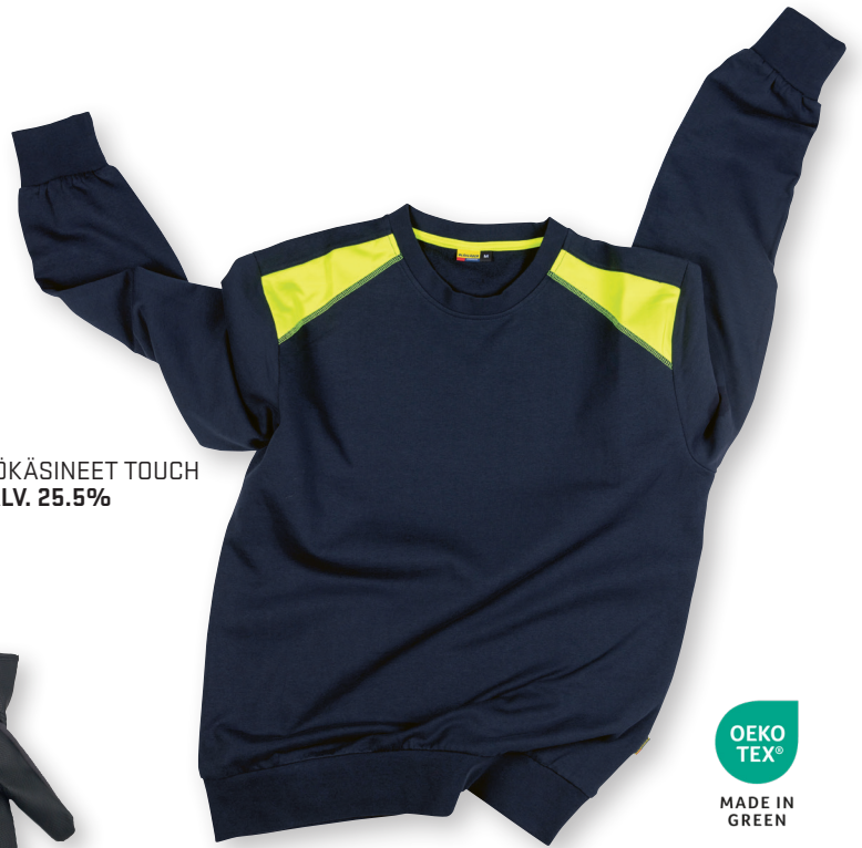
3580 COLLEGE 43.90€+ALV. 25.5%