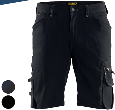
1987 X1900 SHORTSIT 4-WAY STRETCH 152.90€+ALV. 25.5%

1644 93% polyamidi, 7% elastaani, dobby, vettäyhkivä, neljään suuntaan joustava stretch, 295g/m 2