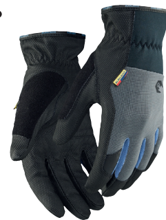
2851 TYÖKÄSINEET, SUPREME STRONG 21.90€+ALV. 25.5%