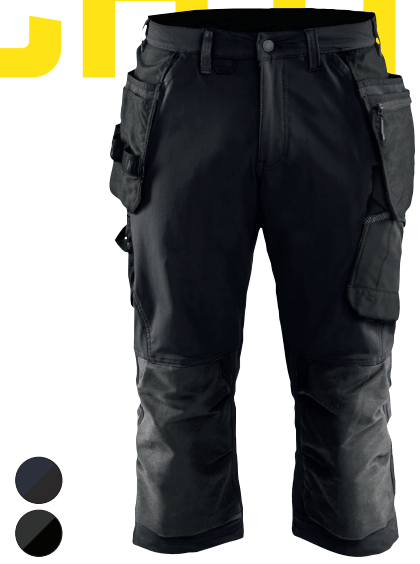
1521 PIRAATTIHOUSUT 4-WAY STRETCH 161.90€+ALV. 25.5%

Shortsiversio riipputaskuhoususta 1522, hieman ohuemmalla neljään suuntaan joustavalla materiaalilla, joka tuo maksimaalista mukavuutta. Kapea malli. Riipputaskut, joista toinen vetoketjulla, palkeelliset takataskut, joista toinen vetoketjulla, mittatasku ja työkalulenkkit sekä oikealla että vasemmalla puolella. Täydellinen vaate lämpimille päiville.