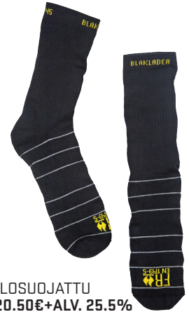
2505 PALOSUOJATTU SUKKA 20.50€+ALV. 25.5%