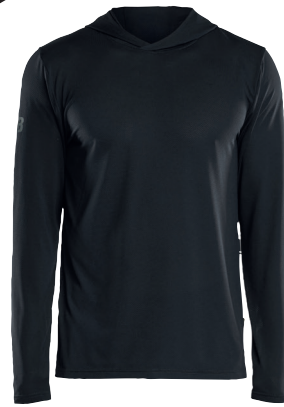
3417 TEKNINEN HUPPARI, UV-SUOJA 40.90€+ALV. 25.5%