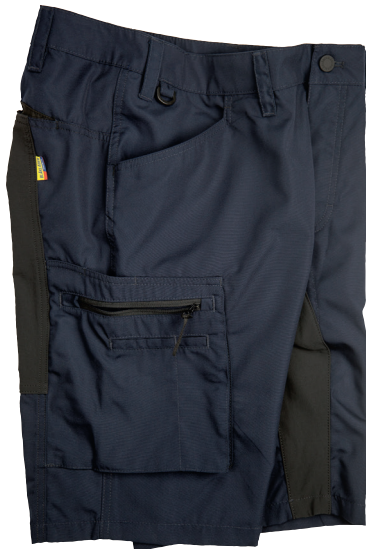
1449 SHORTSIT STRETCH 78.90€+ALV. 25.5%