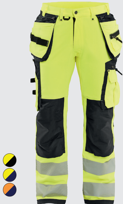
1997 / HIGHVIS RIIPPUTASKUHOUSUT 4-WAY STRETCH / 219.00€+ALV. 25.5%