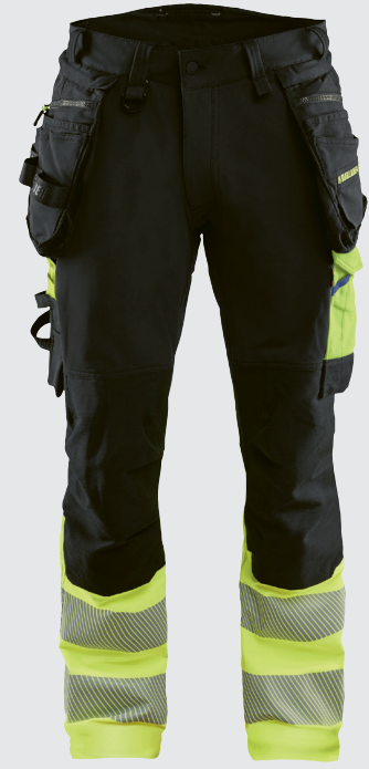
1125 / HIGHVIS RIIPPUTASKUHOUSUT 4-WAY STRETCH / 179.00€+ALV. 25.5%