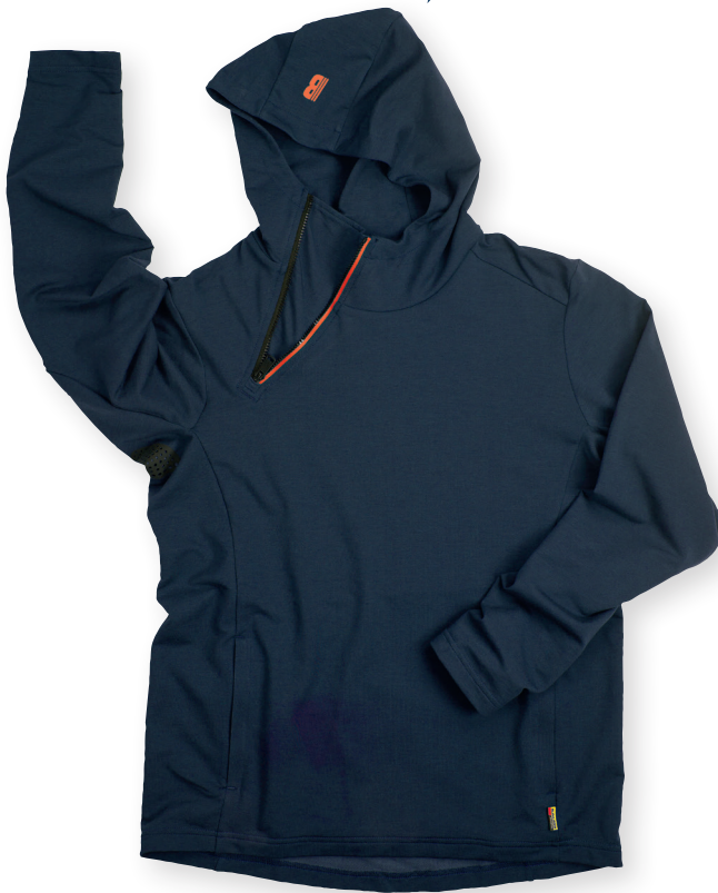
3594 TEKNINEN HUPPARI LYHYELLÄ VETOKETJULLA 79.80€+ALV. 25.5%