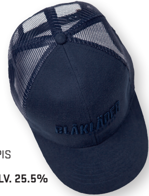
2075 LIPPIS TRUCKER 17.90€+ALV. 25.5%