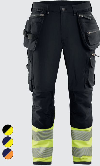
1993 / HIGHVIS RIIPPUTASKUHOUSUT 4-WAY STRETCH / 213.00€+ALV. 25.5%