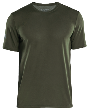
3415 TEKNINEN T-PAITA, UV-SUOJA 28.50€+ALV. 25.5%