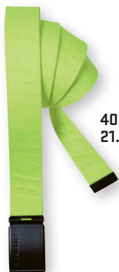
4034 VYÖ 21.90€+ALV. 25.5%