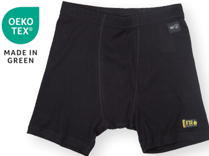
1828 PALOSUOJATUT BOXERIT 35.90€+ALV. 25.5%