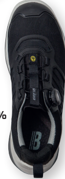
2487 STRIKER TURVAKENKÄ SIPS 185.00€+ALV. 25.5% NAISTEN LESTI KOOSSA 35-39.