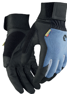
2852 TYÖKÄSINEET, SUPREME STRONG 21.90€+ALV. 25.5%