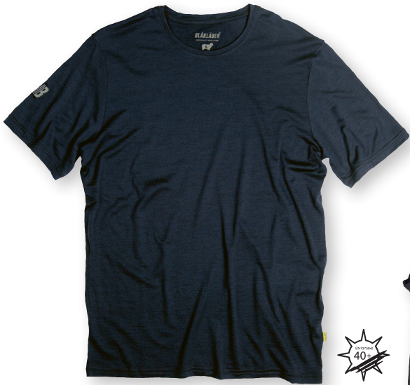
3415 TEKNINEN T-PAITA, UV-SUOJA 28.50€+ALV. 25.5%