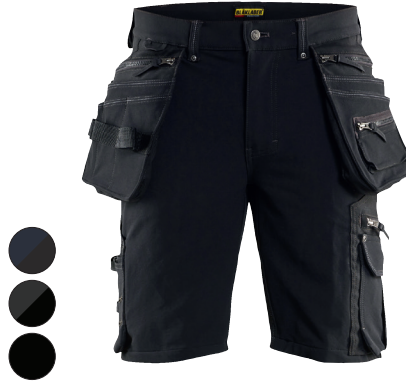
1988 X1900 RIIPPUTASKUSHORTSIT 4-WAY STRETCH 172.90€+ALV. 25.5%

Shortsit neljään suuntaan joustavalla stretch kankaalla. Shortsit perustuvat malliltaan housuun 1998. Shortsit on ilman riipputaskuja, mutta muita taskuja on paljon kuten reisitaskut molemmin puolin.