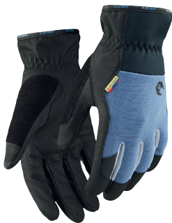
2850 TYÖKÄSINEET, SUPREME STRONG 20.90€+ALV. 25.5%