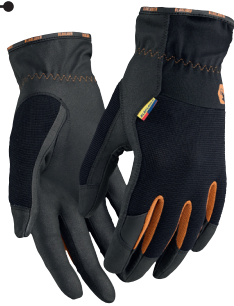
2860 TYÖHANSKAT, SUPREME STRONG 16.90€+ALV. 25.5%