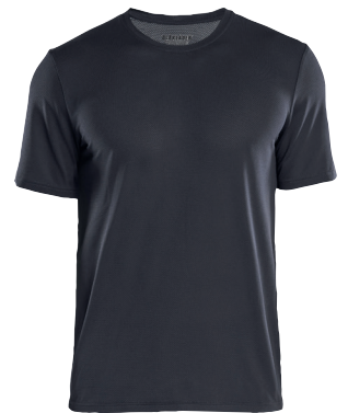
3415 TEKNINEN T-PAITA, UV-SUOJA 28.50€+ALV. 25.5%