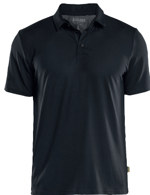
3416 TEKNINEN PIKEEPAITA, UV-SUOJA 33.90€+ALV. 25.5%