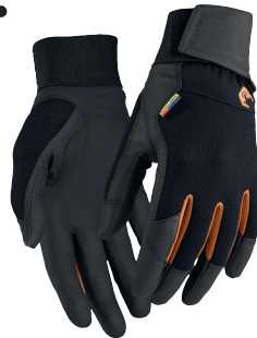
2862 TYÖHANSKAT, SUPREME STRONG 17.90€+ALV. 25.5%