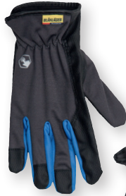
2873 TYÖKÄSINEET TOUCH 4.80€+ALV. 25.5%