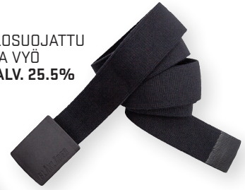
4039 PALOSUOJATTU JOUSTAVA VYÖ 35.90€+ALV. 25.5%