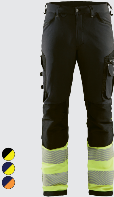
1193 / HIGHVIS HOUSUT 4-WAY STRETCH / 207.00€+ALV. 25.5%