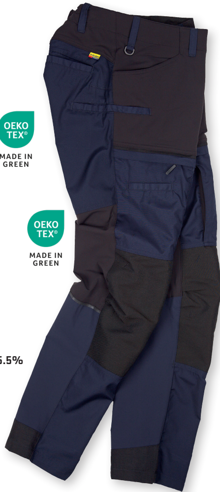
1456 HOUSUT STRETCH 110.90€+ALV. 25.5%