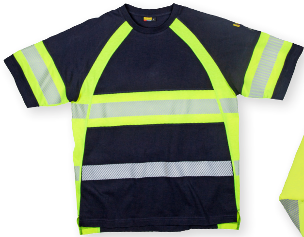
3519 MULTINORM T-PAITA 89.00€+ALV. 25.5%