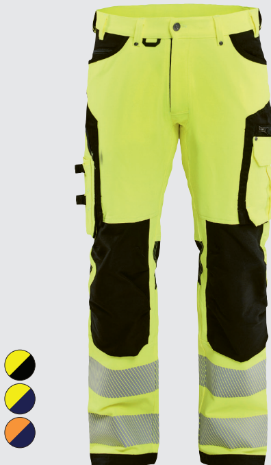
1197 / HIGHVIS HOUSUT 4-WAY STRETCH / 214.00€+ALV. 25.5%