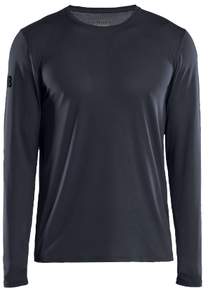
3423 PITKÄHIHAINEN TEKNINEN T-PAITA, UV-SUOJA 33.90€+ALV. 25.5%