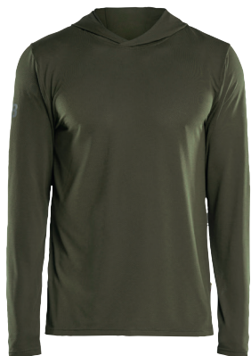
3417 TEKNINEN HUPPARI, UV-SUOJA 40.90€+ALV. 25.5%