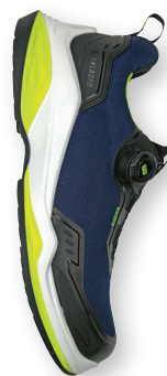
2486 STRIKER TURVAKENKÄ S3S 189.00€+ALV. 25.5% NAISTEN LESTI KOOSNA 35-39