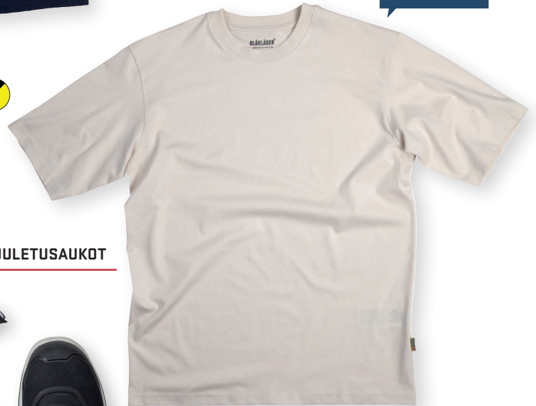
3429 T-PAITA, LOOSE FIT 17.50€+ALV. 25.5%