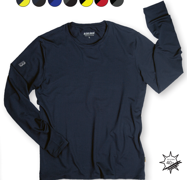
3423 PITKÄHIHAINEN TEKNINEN T-PAITA, UV-SUOJA 33.90€+ALV. 25.5%