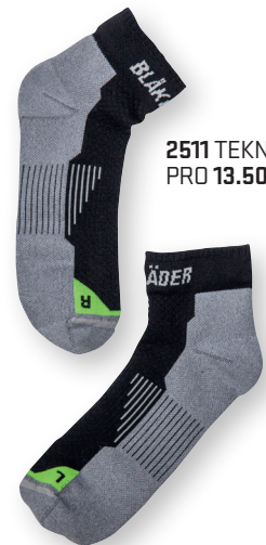
2511 TEKNINEN SUKKA PRO 13.50€+ALV. 25.5%