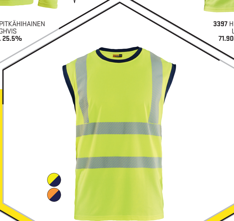
3397 HIGHVIS T-PAITA, UV-SUOJA 71.90€+ALV. 25.5%