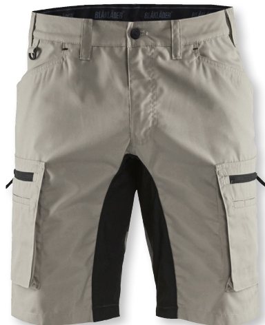
1449 SHORTSIT STRETCH 78.90€+ALV. 25.5%